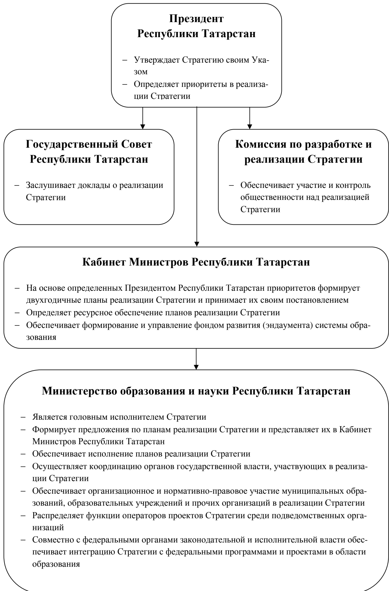
Рис. 2. Система управления реализацией Стратегии